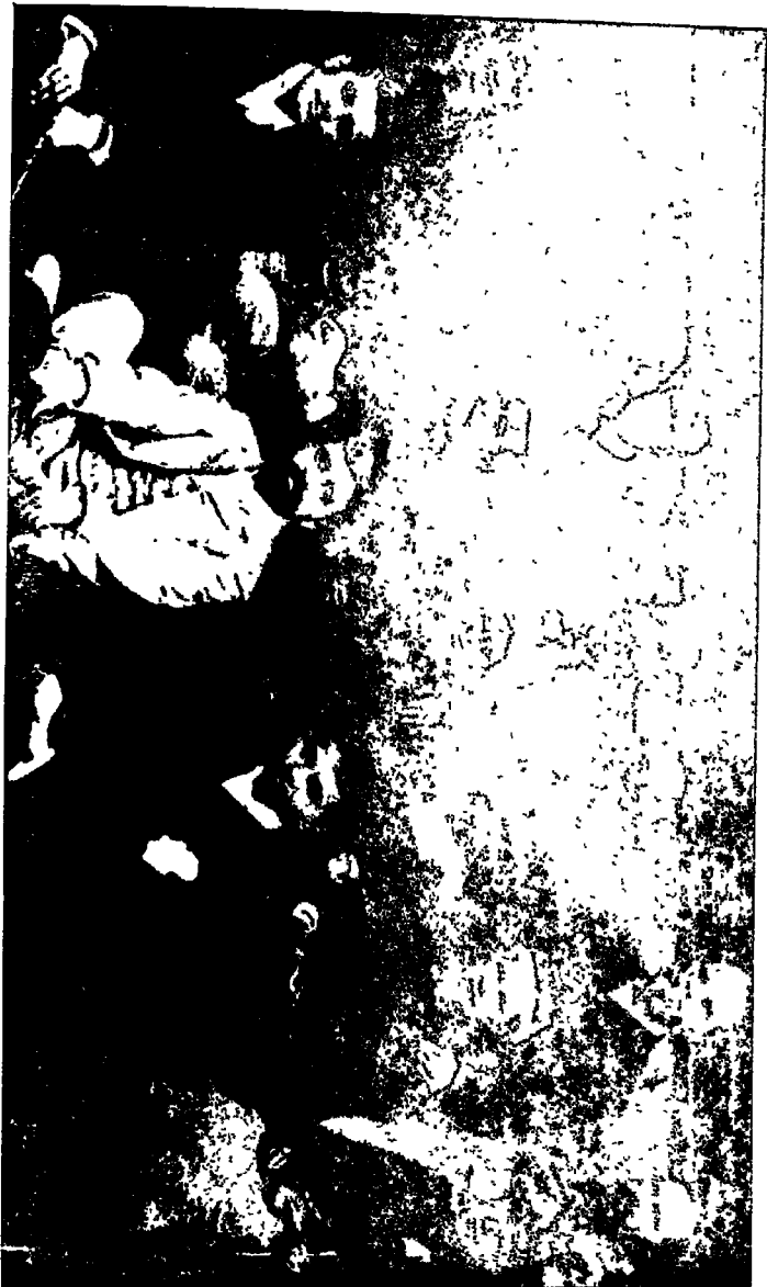
गांधीजी : कदन अशाहारी मण्डलके अन्य सदस्यके साथ, १८९०